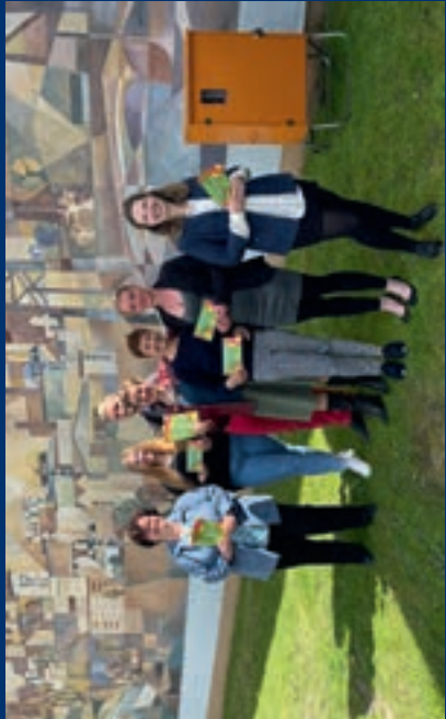
Das Opernale-Team 2022

Der gemeinnützige Verein OPERNALE e.V. hat sich 2010 in Sundhagen, Landkreis Vorpommern-Rügen, mit dem Zweck gegründet, die Darstellenden Künste in Mecklenburg-Vorpommern zu fördern. Er ist Träger des Opernale INSTITUTS für Musik & Theater, das 2018 ins Leben gerufen wurde. Durch vielfältige Angebote gibt es Vorpommernern